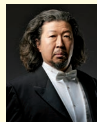
Hidekazu Tsunaya ©Tadafumi Ueno