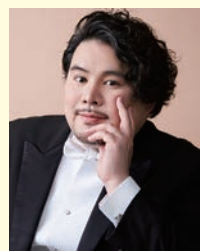
Naoki Miyazato